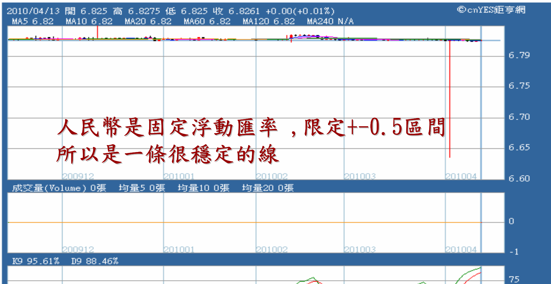
美元/人民幣日線圖